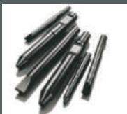
Todo tipo de marcas de puntas.